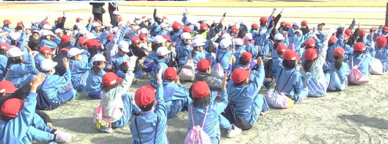
閉会式で、すすんで挙手をして感想を発表する八幡っ子