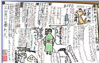
写真上は国語の読み物教材