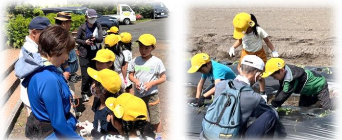
5/20 いきいき交流活動(芋植え)