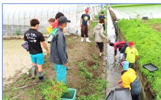
田植えが終わった後も手際が良く終了

令和2年度【有明中学校区共有目標】～未来の創り手となる児童・生徒の育成～ とありますが、4Hクラブの若い青年たち(20~26歳)は、まさにこの横島地域の『創り手』となっていると思います。「ぼくたちも小学校の時に田植えをしました」ととても懐かしそうでした。そして、青年たちも子どもたちと一緒に前川さんから田植えのご指導を受けていました。この青年たちとは8~14年ぶりぐらいに会いましたが「元気ですよ」「みんな仕事がんばっていますよ」とたくましくなっていていい出会いでした。