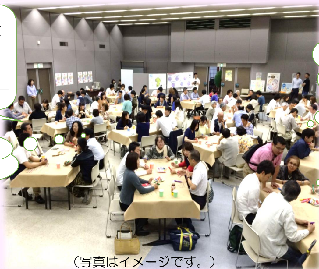
(写真はイメージです。)