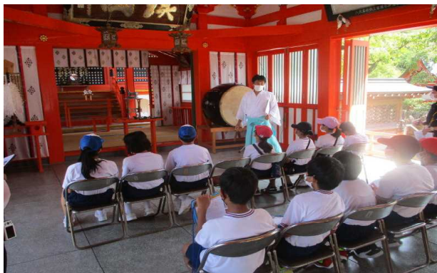
「みやじの歴史」 八代神社(妙見宮)