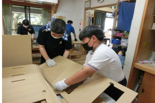
「人権 とともに生きる」 とら太の会の活動