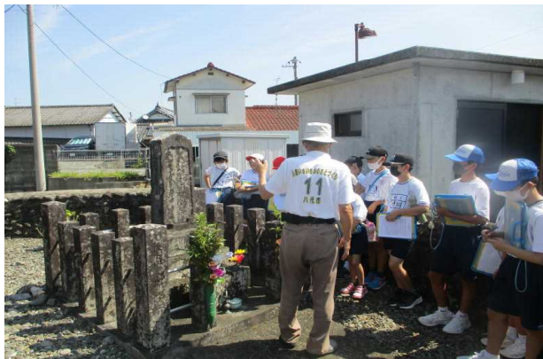
「人権 とともに生きる」 八代の部落解放運動