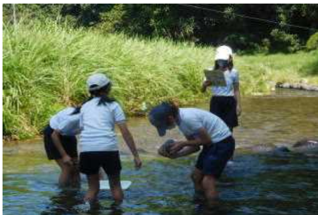
「自然とともに」 環境調査 ～地域の河川調査～