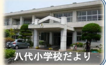
八代小学校だより