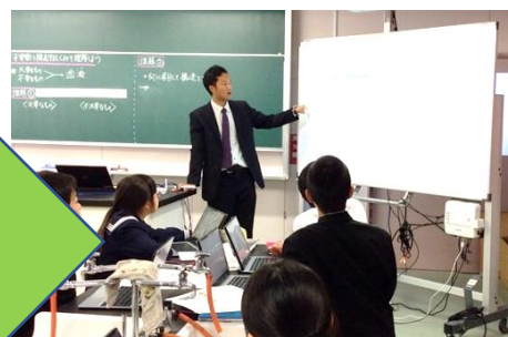
＜教師による教材の提示＞ 画像の拡大提示や書き込み、音声、動画などの活用