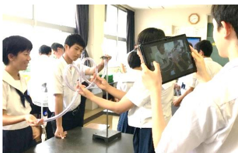
＜調査活動＞ インターネットを用いた情報収集、写真や動画等による記録

文部科学省のGIGAスクール構想によるタブレットパソコンの子供1人1台環境は、これからの時代を生きていく子供たちが確かな学力を身に付けることができるように、そして、コロナ禍においても学習活動を円滑に実施できるようにという考えから進められているものです。八代市においても、1月から本格導入できるように順次環境整備を進めてきました。これから1人1台端末を有効活用し、よりよい学習になるよう取り組んでいきます。