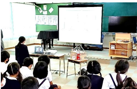
＜遠隔地との交流＞ 交流校や社会科見学先等の遠隔地との交流学習

※ICTとは、通信技術を使って人とインターネット、人と人がつながる技術のことです。