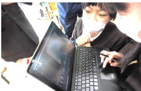
＜協働での意見整理＞ 多様な意見・考えを議論して整理