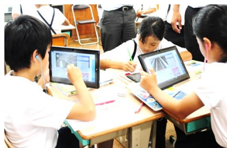
＜子供の個に応じる学習＞ 一人一人の習熟の程度に応じた学習