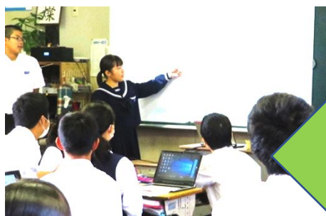
＜発表や話し合い＞ グループや学級全体での発表・話し合い