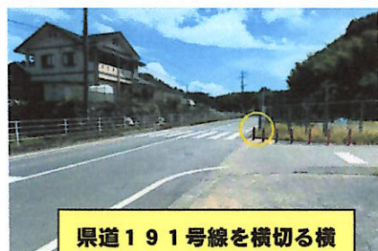
県道191号線を横切る横断歩道：見通しが悪く危険

5月に各学校からお知らせした通学路の危険箇所を行政やPTA会長さん等で、実際に見て回り、対策を考える「玉東町通学路安全推進協議会」がありました。この会のお陰で、昨年度は①サクラハイツ前辺りの横断歩道の再塗装②山北保育園の前に横断歩道設置③西川自動車の前に歩道設置などの対策をしていただきました。本年度は、①JAから学校方面に向けて、県道を横断する横断歩道の見通しが悪くて危険な場所②JAから原倉方面に上っていく県道の路肩に落ち葉等がたまり段差に気付かずに転倒する事故がおきている場所③年の神付近のカラー塗装が消えかかっている場所などを見て回りました。今後、これらの場所の安全を確保できるように行政等も動かれます。この会は毎年実施しています。通学路で非常に危ないと思われる箇所がありましたら、学校かPTA会長さんにお知らせください。来年度の協議会上げた方がよいか、校内で検討します。よろしくお祈りします。