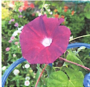
1年生が大事に育てているあさがお

今年も猛暑になりそうです。朝の涼しい内に、毎日、勉強をして、学力向上も意識して自分を高めたいと思います。子どもたちが主体的に、自分や家族のために頑張り、充実した思いを味わえる夏休みになりますようにお願いします。また、ご家庭では、体調管理、食事の準備、生活リズムの管理等、大変お世話になります。家族とのふれ合いの時間もたっぷりあって、楽しい思い出できるといいなあと思います。8月29日に元気な姿を見せてくれることを楽しみにしています。