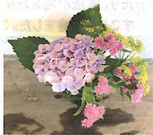
校内を彩る素敵なお花