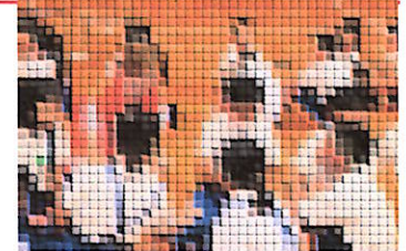
低学年 人権集会の様子

6月27日(木)低・高に分かれて、それぞれ人権集会を行いました。本年度は、地域の人権擁護員さんと一緒に学