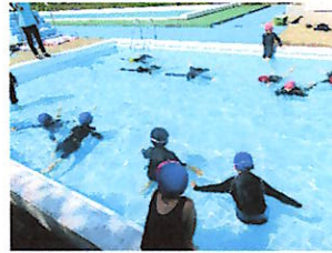
低学年の様子:伏し浮きも上手になっています。

6月10日から、低・中・高に分かれて、プール開きを行いました。みんなで、本年度も安全に学習して、泳力と体力向上ができるようにと願って学習を始めました。小雨でも水