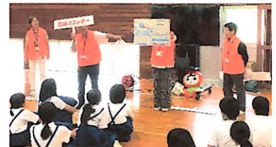
高学年 人権集会の様子

習しました。人権擁護員さんと一緒にDVDを見て、内容を確認して感想を伝え合い、考えを深めました。低学年は、DVD「男らしい色女らしい色」を見て、思い込みや偏見にとらわれることの無意味さに気付き、自分らしくあることの素晴らしさ、他者を尊重することの大切さを学びました。高学年は、DVD「インターネットと人権」を見て、インターネットの上での深刻な人権侵害を受けることが増加していること、人権侵害を改善するためにインターネット上における人権尊重や安全な利用に関する理解を深めることが大切であることを学びました。地域に相談できる人権擁護員さんがおられること、困ったときにミニレターを投函すると解決につながることを、など一人で悩まないで相談する方法も教えていただきました。子どもたちの人権を守るために、地域にも強い味方がいることもわかる時間になりました。