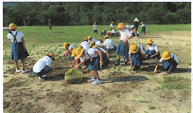
草取り大会フェスティバルの様子

フェスティバル」を実施しました。運動場は、雨と高温の日が続くために草が伸びています。学級対抗で草をとり、とった草の重さを競いました。どの学年も一生懸命でした。その後も「スリッパびったり作戦」等の大作戦が続き、学校がスッキークリーンになりました。子どもたちが主体的に活動し成長しています。