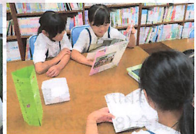
消しゴムのゴミ入れ設置