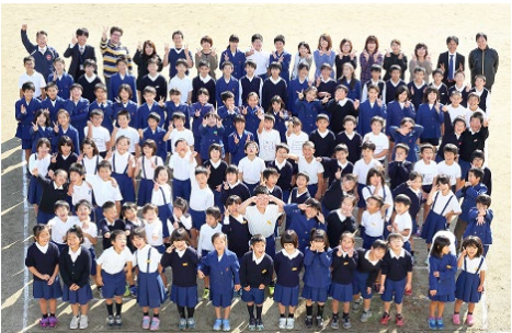
115人の仲間と15人の先生たち

とは言え、個に応じた丁寧な取組によって、この二年間、不登校児童を一人も出していないことには胸を張れます。四月からすべての児童が一つ階段を上がります。中学生になる六年生も含めて、今後、子供たち一人一人がどのような成長をしてくるか楽しみです。一年間、誠にありがとうございました。