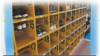
あたり前を積み重ねる

学習センターに『あたり前を積み重ねよう』あいさつ 名札 くつ並べ』と題してかかとのきちんとそろった靴箱の写真が掲示してあります。一つ一つは小さなことでも、毎日大切に積み重ねることで、信頼や自信、そして大きな成長につながります。