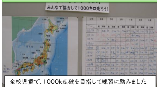
全校児童で、1000k走破を目指して練習に励みました