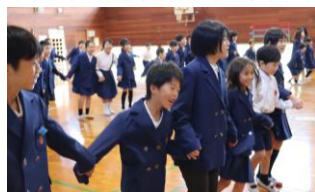
アイスブレイキングで心ほぐし