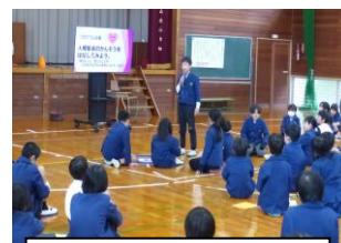
学習の振り返り・感想発表

26日(水)に実施した人権集会では、各学年から標語やポスターの発表、縦割り班によるアイスブレイキングや人権クロスロード、読み聞かせや6年生の平和宣言など、参加体験型の活動を通して自分自身のこれまでを振り返り、相手の立場に立って考えることの大切さを見つめ直す機会となりました。感想や振り返りを伝え合う時間もあり、わたしたち大人もいろいろと学ぶことができました。この他にも、人権月間を踏まえてトイレのスリッパ並べのポスター作成や「ありがとうメッセージ」の掲示、一人一鉢のプレートづくり、あいさつ運動など心が温くなる取組を考えてれています。これからも山北の子どもたちが、心優しく育ってくれることを願っています。