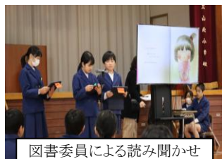
図書委員による読み聞かせ

26日(水)に実施した人権集会では、各学年から標語やポスターの発表、縦割り班によるアイスブレイキングや人権クロスロード、読み聞かせや6年生の平和宣言など、参加体験型の活動を通して自分自身のこれまでを振り返り、相手の立場に立って考えることの大切さを見つめ直す機会となりました。感想や振り返りを伝え合う時間もあり、わたしたち大人もいろいろと学ぶことができました。この他にも、人権月間を踏まえてトイレのスリッパ並べのポスター作成や「ありがとうメッセージ」の掲示、一人一鉢のプレートづくり、あいさつ運動など心が温くなる取組を考えてれています。これからも山北の子どもたちが、心優しく育ってくれることを願っています。