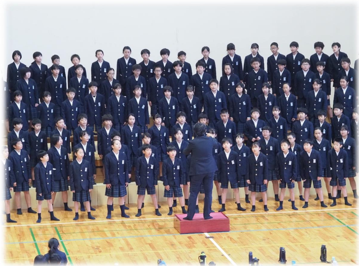
5年：山小コーラス発表会 (10月)