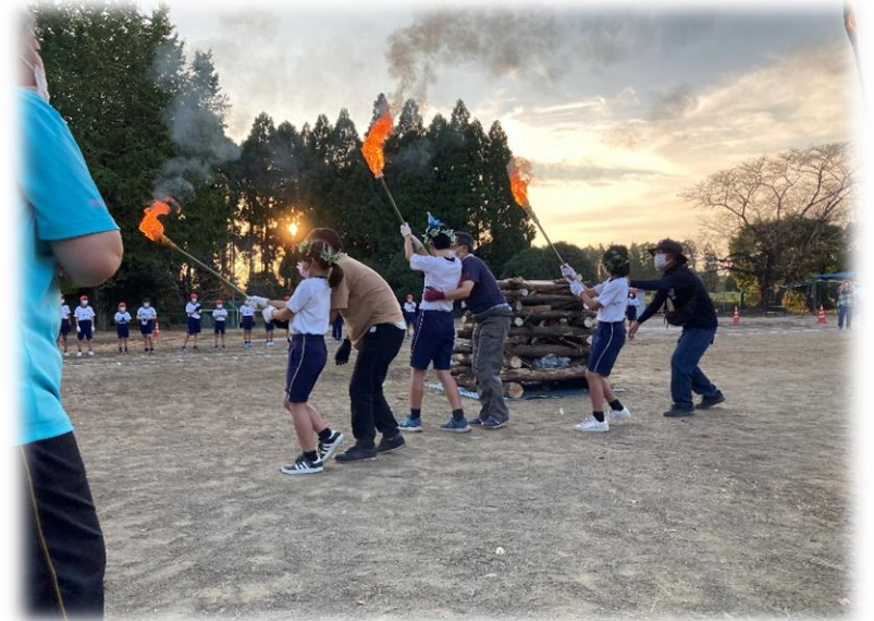
6年：デイキャンプ （川辺）