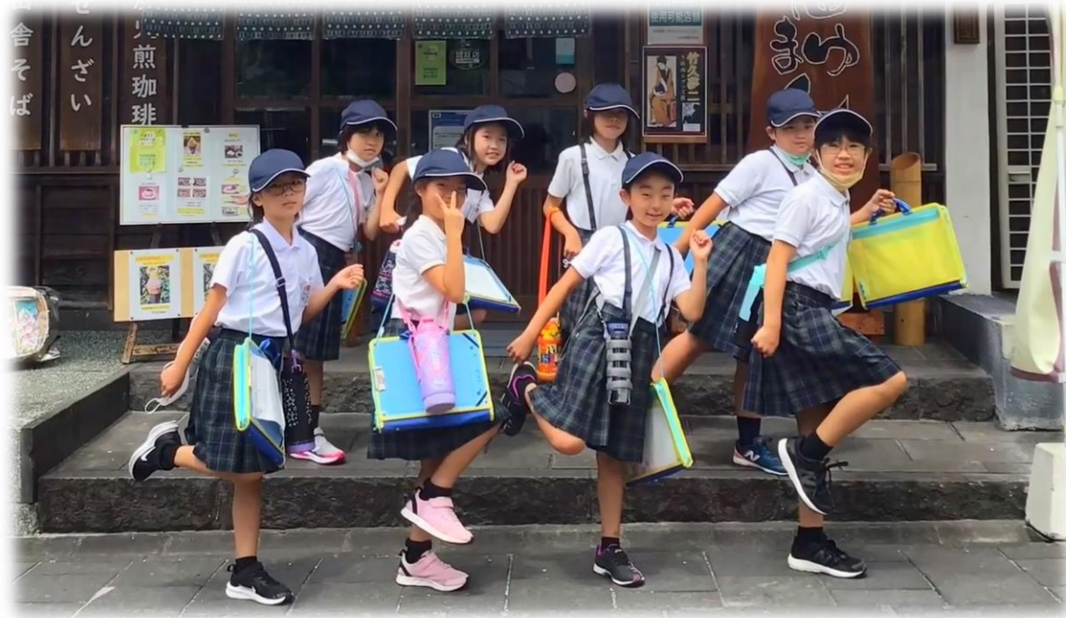
3年：豊前街道動学習発表会 (9月)