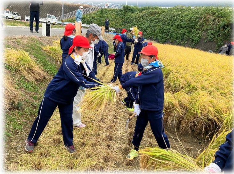
5年：田植え 稲刈り （三岳）