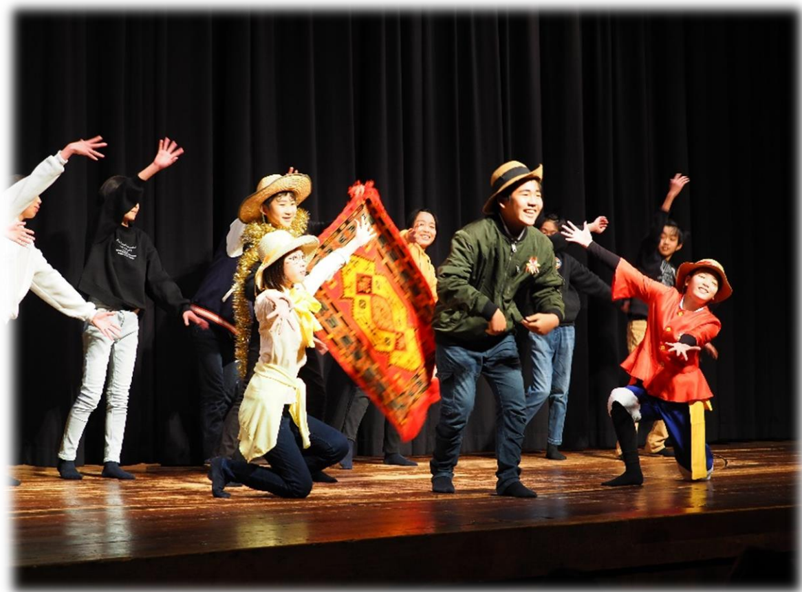
6年：八千代座公演（1月）