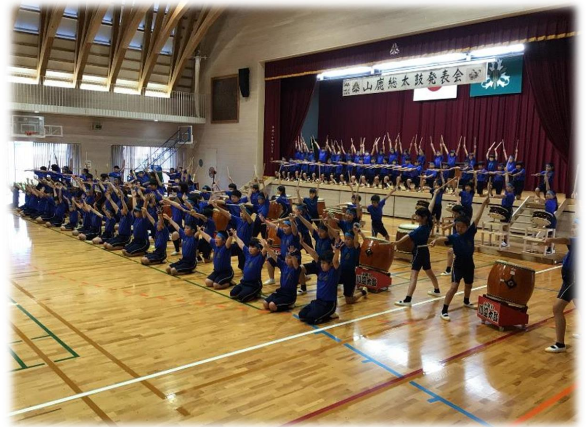
4年：山鹿総太鼓発表会 (7月)