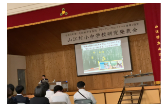
午後からの全体会