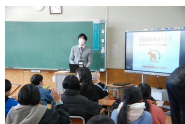
【認知症サポート講座】