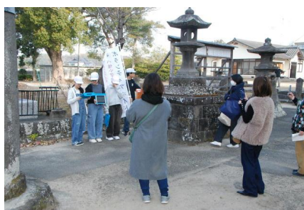
【ボランティアガイドの様子】

3月1日（土）に本年度最後の授業参観・学級懇談会・PTA教育講演会を行いました。土曜日ということもあり、多くの保護者の方に参加いただきました。どの学級も子どもたちが1年間に成長した所などを振り返っていました。特に、6年生は風流の学習の集大成となる「ボランティアガイド」を行いました。先日は、5年生へ引継ぎも兼ねてボランティアガイドを行いました。本日に向けてしっかり練習したり、事前に呼びかけを行ったりして、多くの保護者