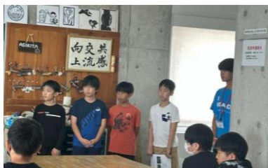
7/3, 4 5年生水俣に学ぶ肥後っ子教室・集団宿泊 語りべさんの話を真剣に聴いたり、集団で行動したりすることの大切さを学びました。