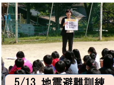
5/13 地震避難訓練 命を守る訓練をしました。