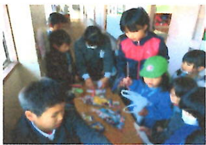
ゲームをする新一年生

来年度入学を迎える新一年生とその保護者の方たちにおいでいただく入学説明会を二月十五日(水)午後から本校パソコン室と五年教室で開催しました。保護者の方たちには、入学前に準備することや健康面での注意すべきことなどについて、現一年担任や養護教諭から説明しました。また、保護者交流会として、地区ごとに自己紹介などをして通学路等についての情報交換を行っていただき、新年生たちは、五年生が用意したゲームなどを教室に行き楽しみ、入学への喜びと期待を感じてくれたことと思います。