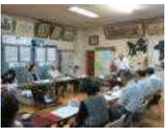
委嘱状交付や協議

地域社会に開かれた、ともに歩む学校づくりを推進するため、今年度、三校区の学校でコミュニティ・スクールとしてスタートします。第一回の会合を五月十二日(月)午後七時より開催しました。学校評議員さんをはじめ、住民自治協議会や民生委員、交通安全協会等、そのほか本校の学習活動に様々な形で支援をいただいている方が集まり、年間計画について協議していただきました。