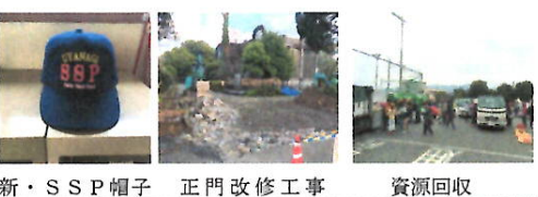
新・SSP帽子 正門改修工事 資源回収

★資源回収(十六日) 日曜日、あいにくの小雨交じりの天気となりましたが、地域や保護者の皆様のご協力により、今年の資源回収の取組を行なうことができました。ありがとうございます。 ★正門改修工事開始(二十日) 以前お知らせしたとおり、ブロック塀のひび割れがあったことから、このたび正門の改修工事が始まりました。南門周辺の駐車場が混雑しますので、ご協力ください。 ★SSP表彰報告会(二十一日) 植柳コミュニティセンターで文科大臣表彰の報告会があり、住民自治協議会から新しい帽子の贈呈がありました。