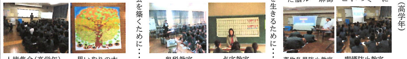
人権集会(高学年) 思いやりの木 租税教室 点字教室 薬物乱用防止教室 喫煙防止教室