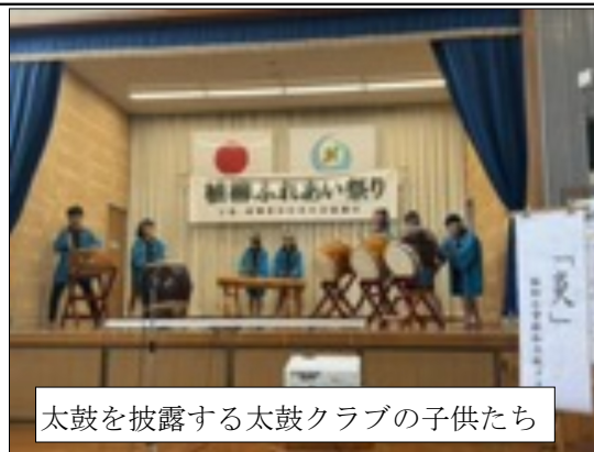
太鼓を披露する太鼓クラブの子供たち

11月15日(土)に、植柳コミュニティ・センターで「植柳ふれあい祭り」が開催されました。本校から今年も和太鼓クラブが出演し、力強くオープニングを飾ってくれました。 会場にはたくさんの子供たちが来ていて、それぞれにふれあい祭りの雰囲気を楽しんでいました。これまで準備に携わってこられた住民自治会の皆様やお手伝いいただいた皆様には、子供たちに出演の機会をつくっていただき深く感謝いたします。