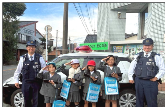
植柳交番の方々と記念撮影する子供たち