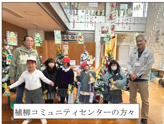
植柳コミュニティセンターの方々

19日(水)に2年生が「まち探検」の学習で、町内の様々な施設を廻り、学習を行いました。町内にある公共の施設から工場、お店など、たくさんの方所で学習をしてきた2年生はとても楽しそうに学習を進めていました。住み慣れた場所でも何気なく目に入る様々な施設でも、働いている人の目線で話を聴くことで勉強になることがたくさんあります。学校を離れて勉強し、自分たちの町のよさを見つけられたことでしょう。 地域の皆様、働いておられる皆様など多くの方々、そして引率のお手伝を引き受けていただいた皆様のご協力でこの学習が進められましたことを心より感謝いたします。