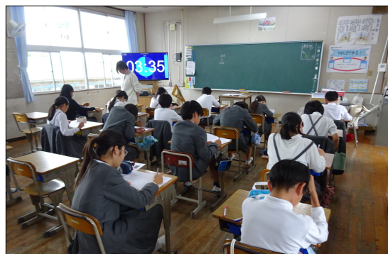
学習状況調査に向けがっちりスタディを頑張る6年生

植柳小学校では来週の12月2日(月)と3日(火)に、熊本県学力・学習状況調査及び八代市学力・学習状況調査を行います。2年生から4年生までは国語と算数を、5年生と6年生は国語、算数に加えて理科と社会の学力・学習状況調査を行います。日頃の単元テストと違って、文章の読み取りや、今までに習った知識を活用しながら自分の考えを説明する(記述を要する)問いが多く出題されています。時間いっぱい、最後まで諦め