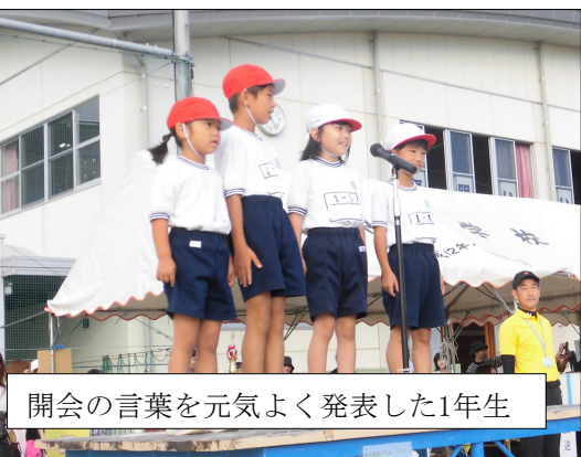
開会の言葉を元気よく発表した1年生

もよかったと思います。そして何よりも、子どもたちの輝いている姿を見て、一人一人が運動会の場を通して成長していることを感じました。