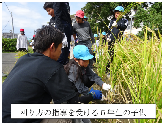
刈り方の指導を受ける5年生の子供