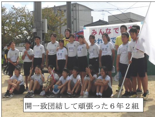
開一致団結して頑張った6年2組