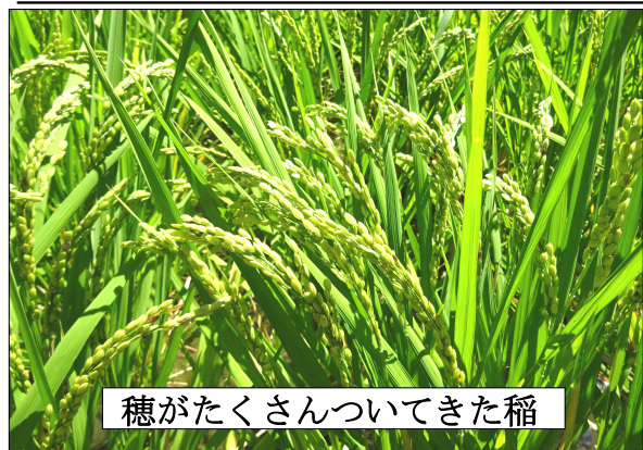
穂がたくさんついてきた稲

この稲のように、植柳の子供たちがすくすくと伸びていけるよう、今後も地域の皆様の知恵と力を借りながら教育活動を進めていきたいと思います。