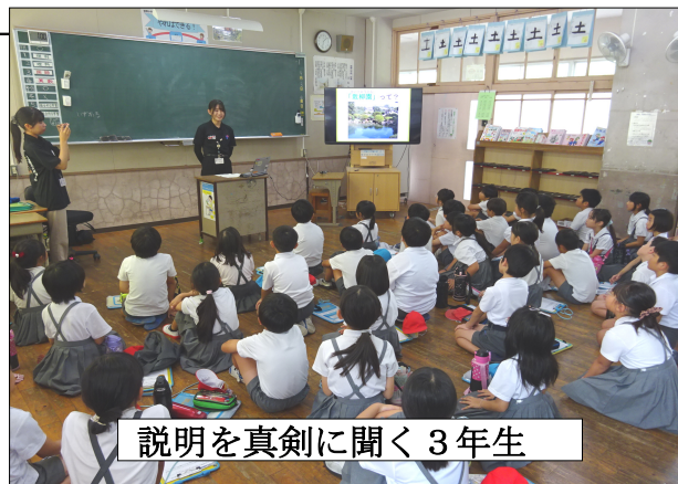
説明を真剣に聞く3年生

身近にありすぎて気づかなかった貴重な史跡について、今回のような学習で深く知ることによって、郷土を愛したり、誇