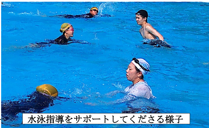
水泳指導をサポートしてくださる様子

「暑さ寒さも彼岸まで」とはご存じの通り、『夏の暑さや冬の寒さが、春分・秋分の彼岸の頃には和らいで過ごしやすくなる』という意味の言葉ですが、本当にこの暑さはお彼岸に落ち着くのでしょうか。今年の秋のお彼岸は9月20日（土）から9月26日（金）までだそうです。