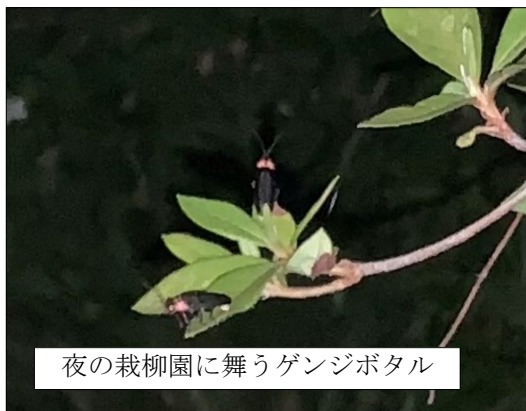
夜の栽柳園に舞うゲンジボタル

五月晴れが広がり過ごしやすい日が続いています。雨の日は車から雨期を迎えます。雨の日は車で送ってもらふ子供たちが多くなり、ずいぶん混雑してくるこゝとが予想されます。他県では学校敷地内で子供をはねるといふ