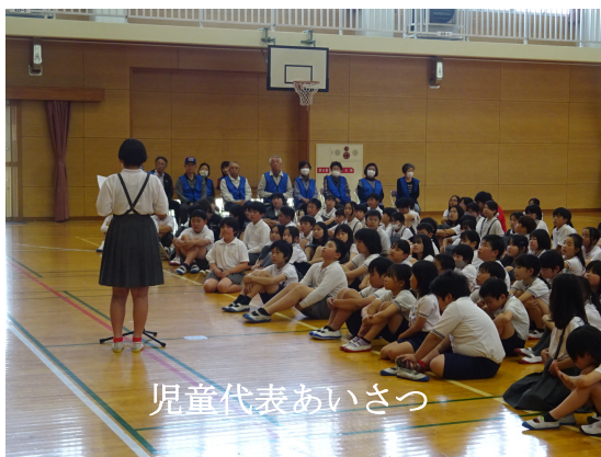
児童代表あいさつ

子供たちのこのような横断態度を示すことは、同じ時刻を通行する車への抑止につながります。是非実行してほしいと思います。集会の最後には、運営委員の代表児童がSSPの方々への感謝の気持ちを伝えました。毎日の感謝の気持ちを伝えるためにも元氣よく「おはようございます」「さようなら」「ありがとうございます」の言葉をしっかりと伝えてほしいと思います。