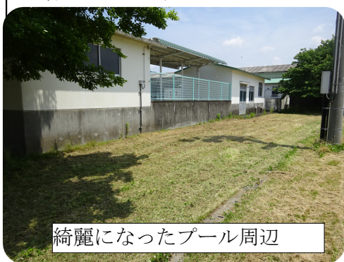
綺麗になったプール周辺

5月の連休が明けて間もない頃、とてもありがたい知らせが入りました。プールの周辺の生い茂った雑草を、ある保護者の方がきれいに刈り取ってくださったというのです。ゆつくり過ごされたい休日に、学校の環境整備に汗を流していただいて本当にありがとうございます。このような方々の善意で教育活動が進められることを深く自覚・感謝して今後も教育活動を進めたいと思います。