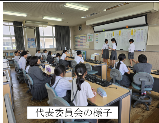
代表委員会の様子

本校では学期に一度、異年齢の児童同士で協力したり、よりよく協力したり、協働して目標を実現したりして学校生活の充実と向上を図ることを目的として運営委員会を中心に各委員会の代表者、3年生以上の学級代表児童が集まって「代表委員会」を行っています。第一回の会議で決まったことをご紹介いたします。 ★必ずやること(全員で決めたこと) ①あいさつについて ・各学年で曜日を決めてあいさつ運動を行う。 ・挨拶を呼びかけるポスターを作る。 ②全学年での交流遊び ・全学年が交流し、楽しいと思