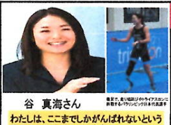
谷 真海さん わたしは、ここまではかかればならないという境界のふたを外しています！

ここで、一人の方を紹介いたします。谷真海(旧姓 佐藤)さん。谷さんは、陸上競技に取り組んでいましたが、大学時代に病気にかかり、右足膝下を切斷されました。