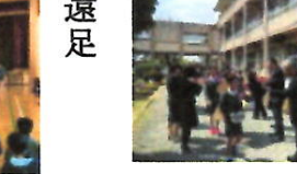
中庭でのお見送り