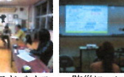
学校医のアドバイス