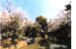
きれいになった白鳥の池

三月十七日(日)、池の水を抜いてヘドロを除去するテレビ番組の収録が裁柳園の白鳥の池で行われました。本校六年生をはじめ、保護者や地元の方々、高年生の皆さんの協力のおかげで無事に終了しました。ありがとうございました。