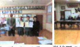
税のポスター入賞