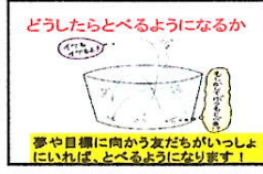
どうしたらとべるようになるか 夢や目標に向かう友だちがいつしよにいれば、とべるようになります！

平成三十年度第七十二回卒業式 三月二十二日(金)、午前十時、卒業生が静かに体育館に入場し、万雷の拍手で職員・在校生や多数の来賓の方々を迎えました。今年の卒業生は四十二名。卒業証書を堂々と受け取り、思いを込めた呼び掛けを交えながら在校生と一緒に披露してくれました。私が卒業生に送った言葉は、「風雪割草」。風や雪に負けない強い草のことを「勁草」と呼びます。中学校でも本校卒業生として元気で頑張つてほしいと思います。