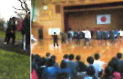
お別れ集会の一コマ