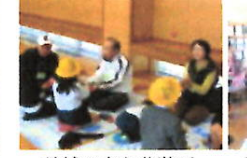
地域の方と昔遊び