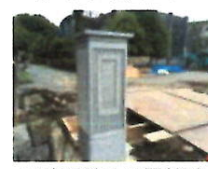
工事が続く正門付近

ホームページでも紹介してきましたが、十二月暮れからの正門の工事も、新しい正門の塔の設置や鉄筋コンクリート床部分に流し込む作業も開始されています。完成が待ち遠しいですね。