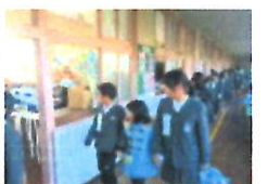
新一年生学校見学の様子

二月十三日(水)、午後から新一年生入学説明会を開催しました。入学説明会では、保護者対象に入学に向けて家庭で準備するものや留意事項について担当者から説明。新一年生は、五年生に連れられて学校見学やゲームを楽しみました。