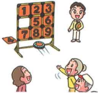
ストラックアウト

ニュースポーツとは、「いつでも」「どこでも」「だれでも」気軽に楽しめるスポーツです。技術やルールが簡単！夏休みは親子で楽しくニュースポーツを体験しませんか！