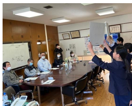
学校評価（保護者）後期