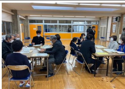
↑学校運営協議会の様子

この会議の中で、小学生も6年生の代表児童が挨拶運動に関する取組の成果を発表し、地域の皆さんと懇談を行うことができました。学校運営協議会の中で毎回取り上げられるのは、子供たちの挨拶についてのお話です。昨年度の学校評価と比較して若干の向上を認めていただいているものの、引き続き、家庭と地域と学校が連携し地域の中で挨拶が自分からできる子供を育てたいと、改めて感じたところでした。各家庭におかれましても、子供たちへの啓発をどうぞよろしくお願いいたします。残り1ヶ月、地域の皆さんの温かい思いを追い風に、年度の最後の仕上げに取り組みたいと思います。