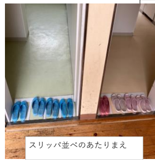
スリッパ並べのあたりまえ