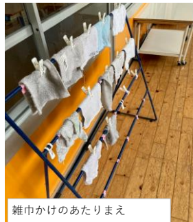
雑巾かけのあたりまえ