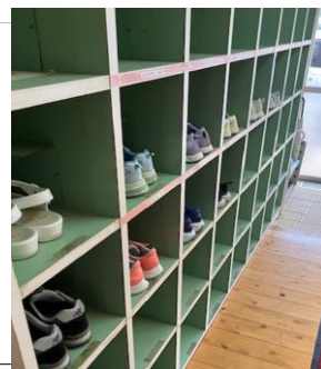
靴のかかとそろえのあたりまえ