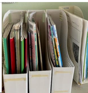
教科書並べのあたりまえ

子供たちに、始業式の中で頑張してほしいこととして「あたりまえの事をあたりまえにできる」という話をしました。各学年の発達段階に応じて、そのあたりまえのレベルが違うものもあれば、学年に関係なく同じであるものもあります。学習に関する「あたりまえ」は高学年ほどレベルが上がり、基本的生活に関することは学年が上がってもやることは変わりません。写真は日常生活の中に見られる「あたりまえ」の場です。現在学年に関係なくできているのはトイレのスリッパ並べがあります。このことは学年をこえた「あたりまえ」として定着した素晴らしい習慣です。3学期は、各学年で小さな「あたりまえ」を増やしていく事に取り組ませたいと思います。