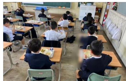
1年生初めての給食の様子