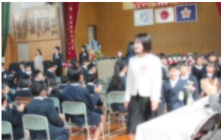
入学式の様子 (4月9日)

式では、「泣いて訴えるのではなく、自分の思いを言葉で表すこと」「嫌なことがあっても暴力ではなく話し合っ解決できるようにすること」「命を大切にすること」を伝えました。入学式翌日から、早速給食も始まりました。子供たちは、日に日に学校生活にも慣れてきています。