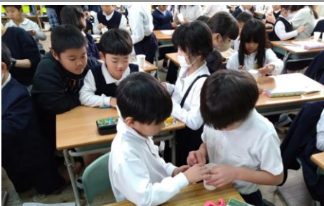
1年生におもちゃの遊び方を説明する2年生

本校の教育目標「しなやかで、凜とした子供の育成」をめざして、『元気・夢・思いやり』を合言葉に、『主体性』『柔軟性』を身につけてほしい力として、全ての教育活動で取り組んできました。 卒業する6年生は、本年度大きな節目となる“創立150周年記念事業に向けて、数々のアイデアで企画し、実現させてきました。また、記念式典でも進捗を卒業生の先輩とともにに行い、子供たちが主役となる取組にしてくれたことを誇りに思います。次なる大きな節目となる200周年の頃には、この地域の中心人材として、今以上に地域を支える存在になつてくれることを願っています。これらの立役者であった118名が、24日に晴れて卒業証書授与式に臨みます。恐らく人生の中で最も長く通学することになる小学校を無事に巣立つことを心から祝福したいと思います。 また、在校生の皆さんもそれぞれ一つ学年が進級しますが、今の自分に満足せず、次なるステージで新たな目標を持ち、その実現に向けて努力をしてください。 保護者の皆様、地域の皆様、この一年間、本校の子供たちが育つ学校・地域への取組に對しまして、ご支援・ご協力本當にありがとうございました。