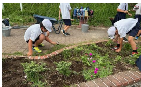
学校前の花壇を日頃から整備してくれた3年生