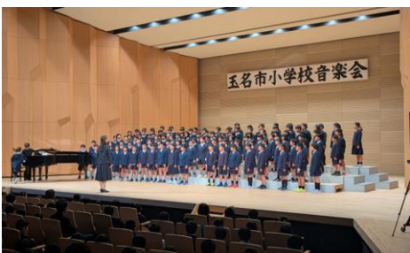
150周年記念ソングを披露した4年生