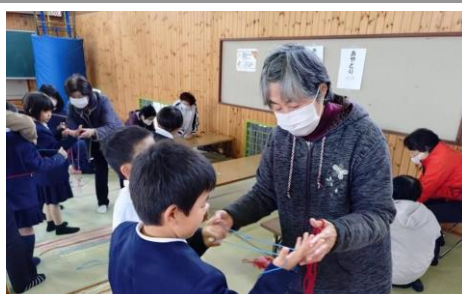
老人会の方と昔遊びを楽しむ1年生