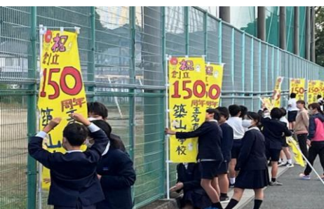
150周年記念事業に主体的に取り組んだ6年生