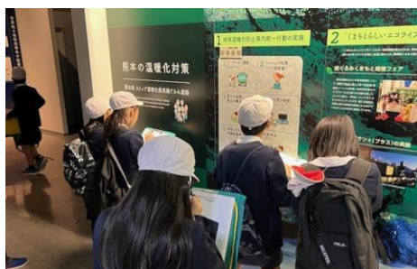
水俣病資料館で環境や差別について学んだ5年生