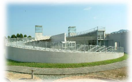
建物は建築家の安藤忠雄氏による設計（くまもとアートポリス作品のひとつ）