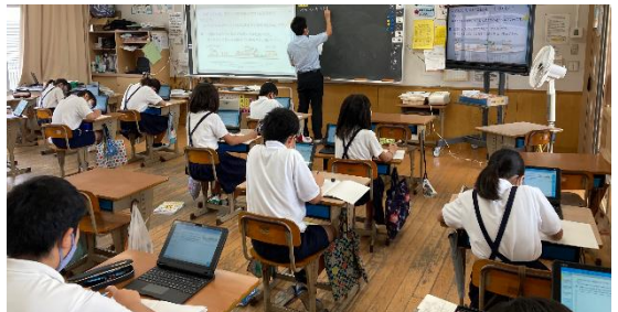
くまもとGIGAスクールプロジェクト中心校の児童の活用の様子（苓北町立苓北西部小学校）