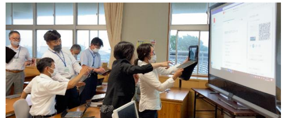
くまもとGIGAスクールプロジェクト中心校の教職員研修の様子（苓北町立富岡小学校）

＜優良校認定されました！＞ R3.5.12 水上村立岩野小学校 R3.5.27 荒尾市立桜山小学校