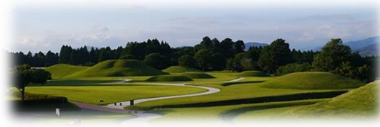
敷地内に県内最大級の前方後円墳「岩原双子塚古墳」と大小の円墳群や横穴群があります。