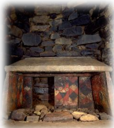
チブサン古墳をはじめ主要な12基の装飾古墳を展示

装飾古墳館は、山鹿市にある、全国でも唯一の県立の装飾古墳専門博物館です。全国に古墳は20万基以上ありますが、絵や文様で飾られた装飾古墳は660基ほどです。そのうち約200基が熊本県内にあり全国1位を誇ります。各体験の詳細は、装飾古墳館HPを御覧ください。