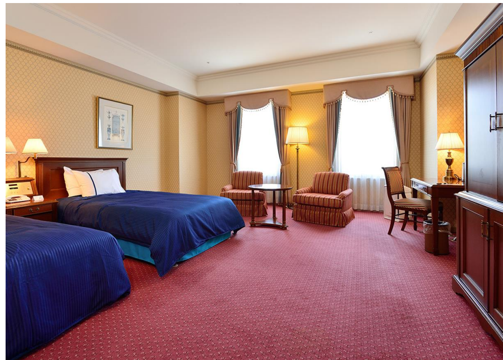
ハウステンボス ウォーターマークホテル