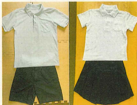
【今後の基準服に準ずる服装の例】

上：白のシャツやブラウス、ポロシャツ（襟付き） ※小さなワンポイント可 下：紺や黒色のズボン（長・短）、スカート（ひざだけ）