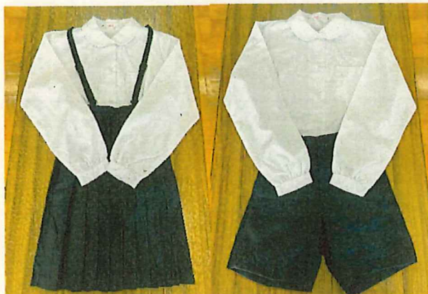
【これまでの基準服の例】

上：規定による白のシャツ及びブラウス 下：規定による黒や濃紺を基本とするズボン・スカート