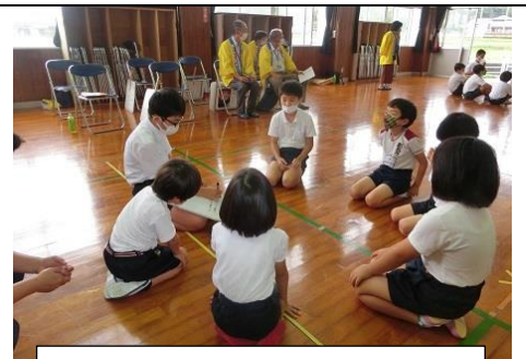
縦割り班での話し合い

一 なまえに「さん」「くん」をつけてよびます 一 ともだちがうれしくなることばややさしいことばをかけます （ぽかぽかことば） 一 ともだちのいいところやじぶんのいいところをみつけみとめ のばしていきます （きらりみつけの木） 一 だれにでもかんしゃの心をわすれずに「ありがとう」をつたえます （ありがとうの木）