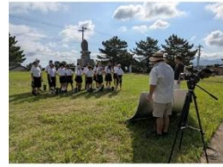
天草小唄動画撮影