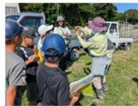
3年社会科レタス農家見学