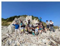
大地のつくりセミナー