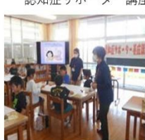
認知症サポーター講座