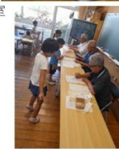
あこうタイム 赤ペン先生