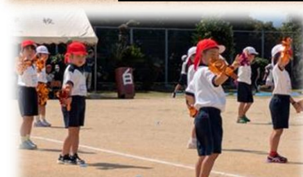
下学年 さかせよう富小ライラック