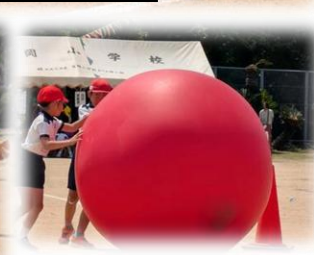
2・3年 あい♡がいっぱい 大玉ころがし