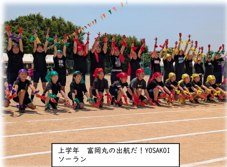
上学年 富岡丸の出航だ! YOSAKOI ソーラン

昨年度まで、そしてそれ以前に富岡小学校にいらっしゃった先生方からも富っ子へ、たくさんの激励の言葉をいただきました。一人一人の心に「最高!」といえる運動会となりました。