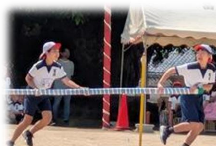
上学年 富岡☆ハリケーン