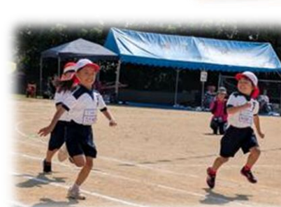
1年 徒走 元気100倍! 1年生