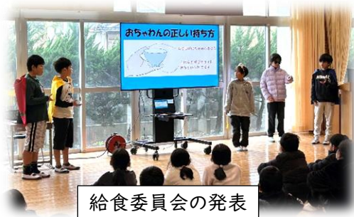
給食委員会の発表