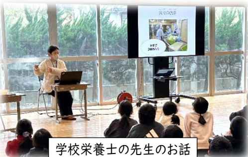
学校栄養士の先生のお話