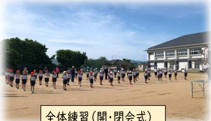
全体練習(開・閉会式)

現在、6月2日(日)の運動会に向けて、競技種目の練習、応援団練習、ライン引き・草取りなどの環境整備・・・等、子供たちも職員も一生懸命取り組み、昨年度の150周年の運動会をこえる最高の運動会にしようと張り切っています。