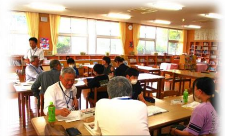
2つのグループに分かれて協議