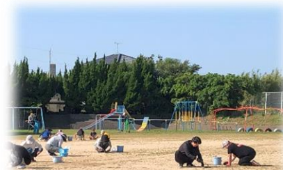
5/10(金) PTA美化作業の様子

富岡小学校児童会で考えた運動会スローガン「 創立151年!最後まで燃え続けろ 赤組 光のように突き進め 白組 創りだそう 新たなキセキを!! 」のもと、保護者の皆様・地域の皆様のご支援・ご協力を得ながら笑顔の花をたくさん咲かせます。どうぞよろしくお願いいたします。