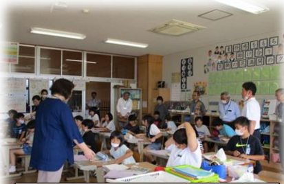
学習の様子を参観(5年・外国語)