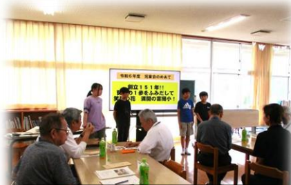
6年生が今年度の児童会めあてを発表