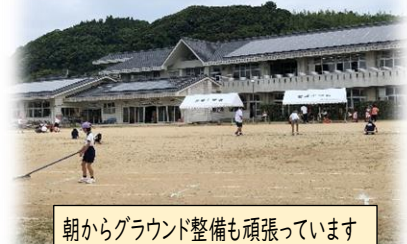
朝からグラウンド整備も頑張っています

また、5月10日(金)、17日(金)の2回にわたって行われたPTA美化作業には、平日の夕方というご多用の時間帯にもかかわらず、多くの方にご参加いただき、ありがとうございます。地域学校協働活動推進員さんも参加してくださいました。おかげ様で、きれいに整った運動場で、子供たちも練習を頑張り、本番当日もその成果を十分発揮することと思います。