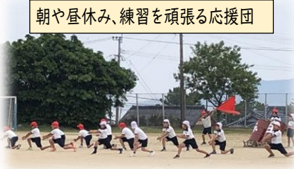
朝や昼休み、練習を頑張る応援団