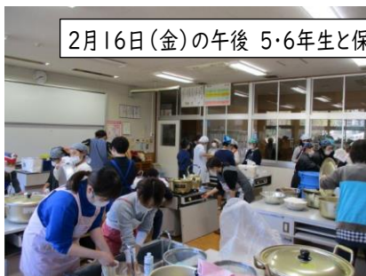
2月16日(金)の午後 5・6年生と保護者で準備を頑張りました

2月18日(日)、授業参観・学級懇談会・臨時PTA総会とあわせて、もちつき大会が実施されました。コロナ禍等で久しく行われておらず、授業参観や学級懇談会と同時に実施できるのだろうかという不安もありましたが、「子供たちに富岡小伝統の行事を体験させてあげたい」という保護者の方の強い思いから見事復活できたもちつき大会でした。実施にあたって、事前の綿密な準備、当日の町議会議員さんご夫妻や富岡女性の会の方々からのご指導、そして多くの保護者の方のご協力のおかげで、子供たちにとって楽しい思い出となり、たくさんの笑顔が見られました。本当にありがとうございました。