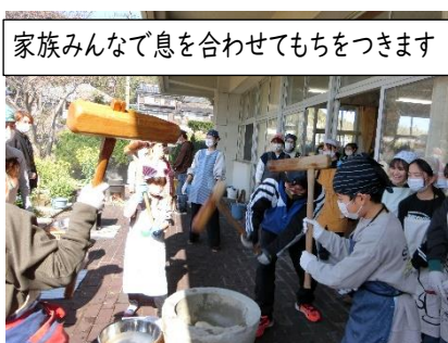
家族みんなで息を合わせてもちをつきます