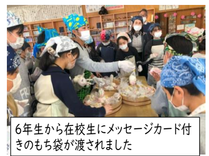
6年生から在校生にメッセージカード付きのもち袋が渡されました

授業参観では、どの学年も1年間の学習のまとめとして、できるようになったことを発表したり、保護者の方へ感謝の気持ちを伝えたりと、子供たちの成長を感じる時間となっていました。