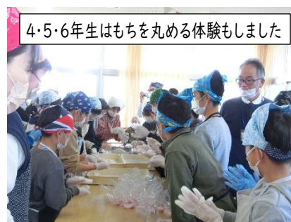
4・5・6年生はもちを丸める体験もしました