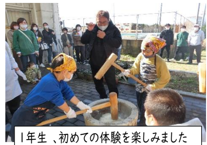
1年生、初めての体験を楽しみました