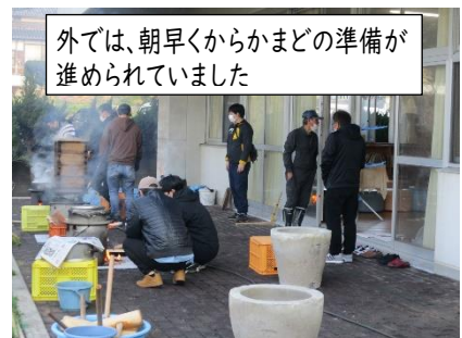
外では、朝早くからかまどの準備が進められていました