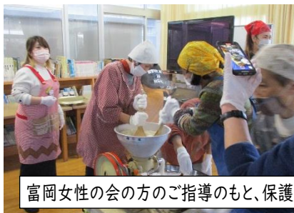
富岡女性の会の方のご指導のもと、保護者の方でもちをちぎり、丸めています