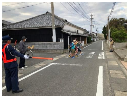
3月15日(水) 今年度最後のあいさつ運動

あいさつ運動による子供たちの登校の見守り、あこうタイムでのプリントの丸つけや励ましの言葉かけによる学習支援、グロスターティーチャーとしての授業支援等、今年度も様々な場面で保護者や地域の方にはご協力をいただきました。コロナ禍で、以前のような交流は活発にはできなかったものの、子供たちにとっては大きな学びがありました。来年度は、コロナによる制限もかなり緩和されていくことと思いますので、積極的な交流を行い、子供たちが地域に貢献していくような活動を進めていくことができると考えております。これからもよろしくお願いいたします。