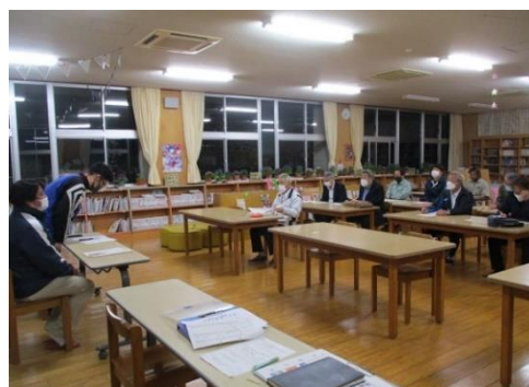
3月16日(木) 実行委員会顔合わせ会の様子

明治6年3月に本校が設立されて、来年度は150周年を迎えます。様々な記念事業を実施し、本校児童や卒業生の皆様、保護者・地域の皆様にとって思い出深い1年にしていきたいと考えています。それに伴い、創立150周年記念事業実行委員会を立ち上げ、実行委員長を中心に4月から記念誌作成、記念式典、記念事業の3つの部会に分かれ、準備を進めていきます。なお、記念式典は11月19日(日)に実施する予定です。今後、記念事業を進めていくための寄付や記念誌の原稿執筆等ご依頼することもあるかと思いますが、ご理解・ご協力のほどよろしくお願いいたします。