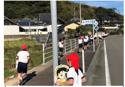
5・6年試走~これから長い道のりが続きます~