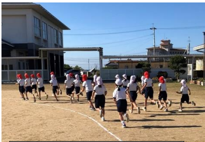
1・2年試走~スタートダッシュすごいです~