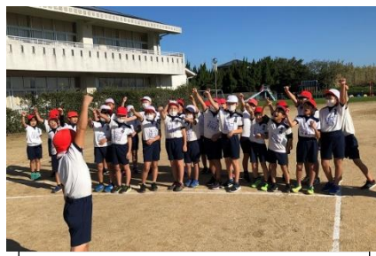
3・4年試走~スタート前の気合い入れ~