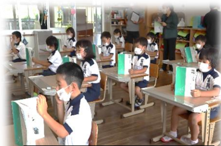
1年生 教科書の音読も上手にできるようになりました。

「元気の花」・・・自分の命、家族や友達の命を大切に思い、それらを守るための行動をしていこう！