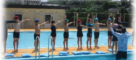
3・4年生 水泳インストラクターによる 水泳指導