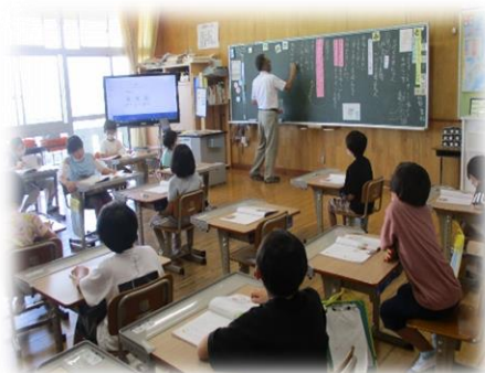
3年生 6月の授業参観では、命の大切さをしっかりと学びました。

明日から42日間の長い休みに入ります。病気、けが等なく、もちろんコロナにも罹らないよう留意して、2学期の始業式で元気な顔が見られることを楽しみにしています。