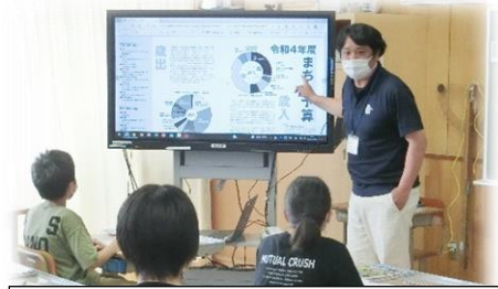
6年生 苓北町役場にお勤めの さんを社会科のGTにお招きして…