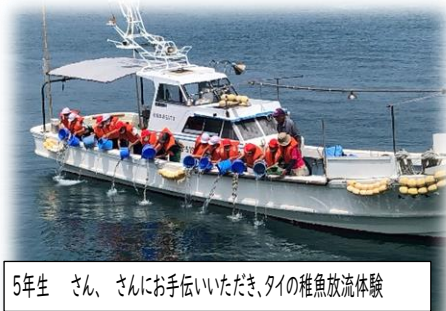
5年生 さん、さんにお手伝いいただき、タイの稚魚放流体験