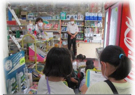
2年生 生活科校外学習「みくりや」訪問