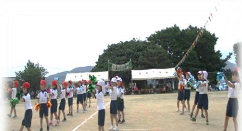
1～3年ダンス BTSの曲に合わせてのりのりでした。