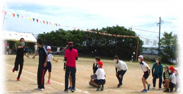
6年親子リレー 親子対決！なかなかの見ものでした。