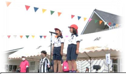
かわいい1年生の言葉で 運動会が始まりました！

保護者そして地域の皆様、これからも「チーム富小」で、子供たちのサポートをよろしくお願いいたします。