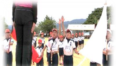
赤団・白団団長による気合いの入った誓いの言葉