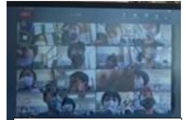
Zoomでつながった1年生

また、今日から「タブレットでの検温入力」をお願いしています。朝の健康状況把握が、感染防止にもつながります。朝の検温等の入力よろしくお祈いします。